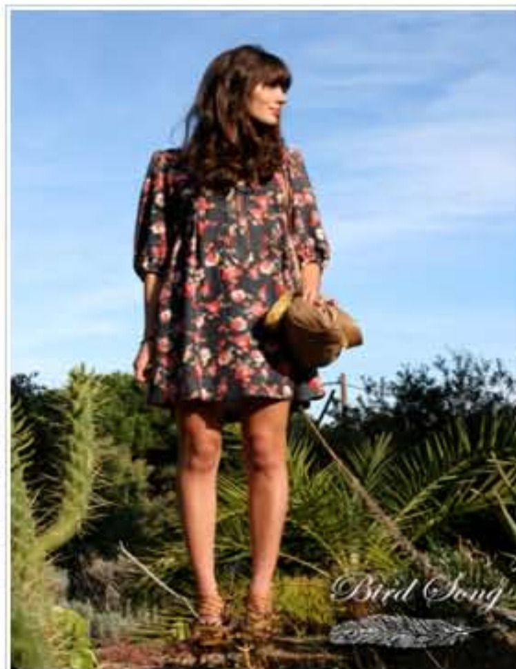
Bird Song : Robe à bretelles Mélissa (157€) / Robe Katia (189€)

Même ambiance chaleureuse et exotique avec APC Madras . Le département plus coloré de la marque arty est né de la collaboration entre son fondateur, Jean Touitou et la Jamaïcaine Jessica Ogden. Leurs créations, fabriquées en Inde, bénéficient de couleurs exceptionnelles et de motifs qui appellent à l'évasion.