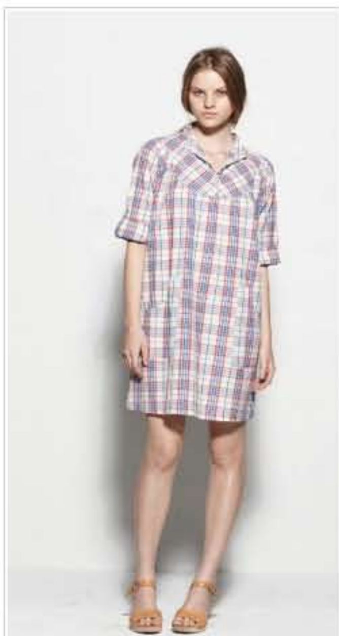
APC Madras : Combi short (189€) / Robe blouse (79€)

APC Madras & Bird Song, collections été 2011 disponibles chez Oogie Lifestore 55 Cours Julien – 13006 Marseille