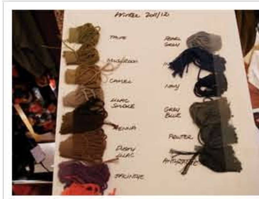
制作のために使うメモや見本がいっぱい！